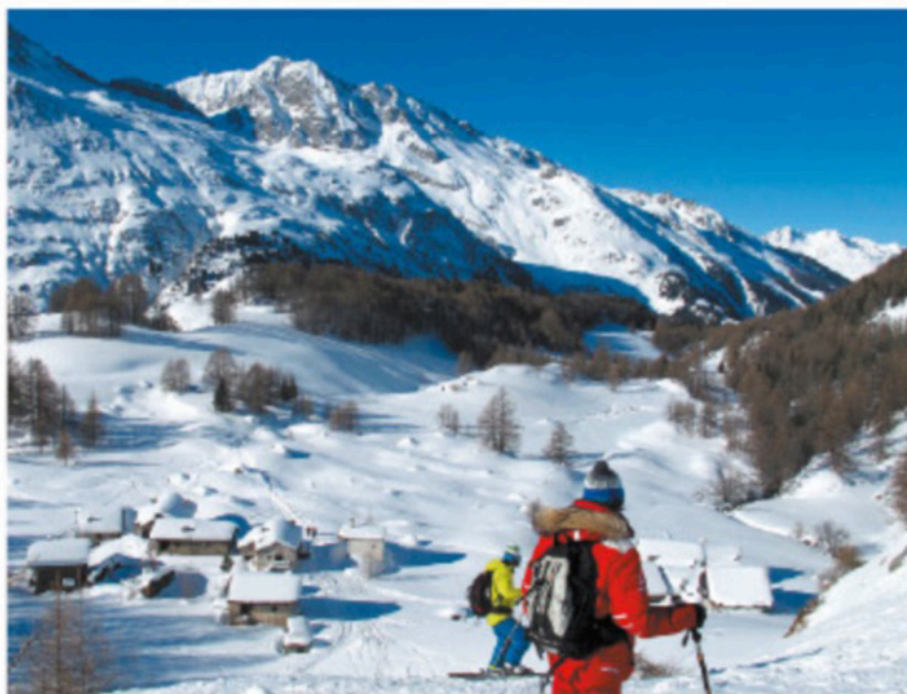
Au hameau du Monal, initiation au hors piste

Ce n'est pas un hasard si l'étendard de Sainte-Foy est « Natural Ski », dans la langue de Shakespeare. Les Anglais ont été les premiers à